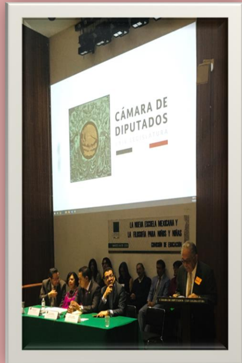
Coloquio "La Nueva Escuela Mexicana y la Filosofía para Niñas y Niños" 4 de marzo 2020

Analizar dichas problemáticas y hacer efectivas las acciones de lo que de allí se derive es un gran reto y logro que ha dado frutos en la implementación de la filosofía en los planes y programas de estudio en Educación básica.